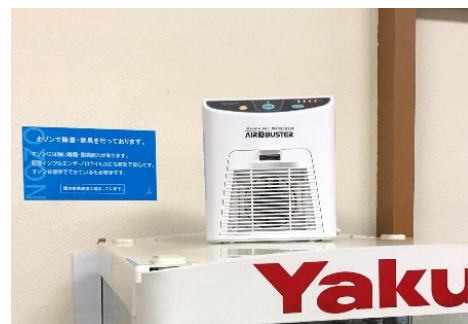
図2 小型オゾンガス発生器