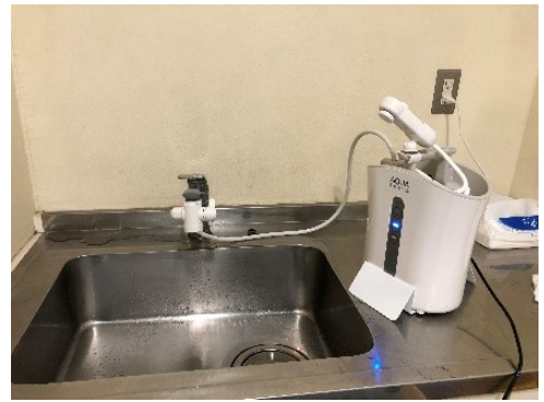
図3 施設内に設置されたオゾン水生成器

オゾンというものが、有名球団を通じて世に情報発信されたことは、それに関わる企業としてはこの上ない喜びであるとともに、今後の社会の役に立てる可能性を強く感じる出来事でした。